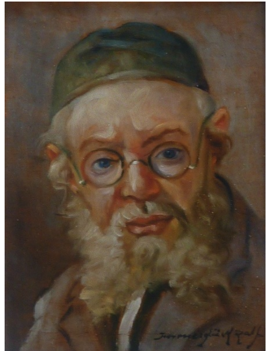
Männliches Porträt. Öl/Karton, 28,5 x 21,5 cm Städtisches Museum Krakau

Ausbildung an der Kunstgewerbeschule in Krakau, dann Studium an der Akademie in Krakau 1915 – 1920 und 1928-29 bei Teodor Axentowicz. Mitglied der Vereinigung jüdischer Maler und Bildhauer. Ausstellungsbeteiligungen 1931, 1933, 1935, 1936, 1937 und 1939. Er malt in Öl und zeichnet mit Pastellkreide, hauptsächlich Porträts von Vertretern der jüdischen Gesellschaft. Modell sitzen ihm auch häufig Bettler. Er sucht eine begrenzte Farbigkeit mit gelben, ockerfarbenen und beige Tönen.